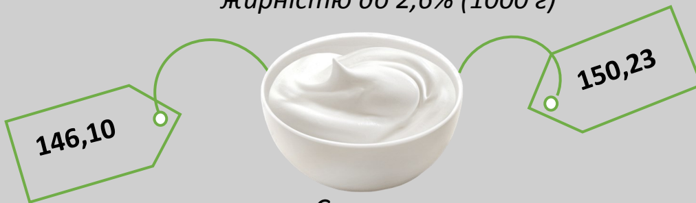
Сметана жирністю до 15% (кг)