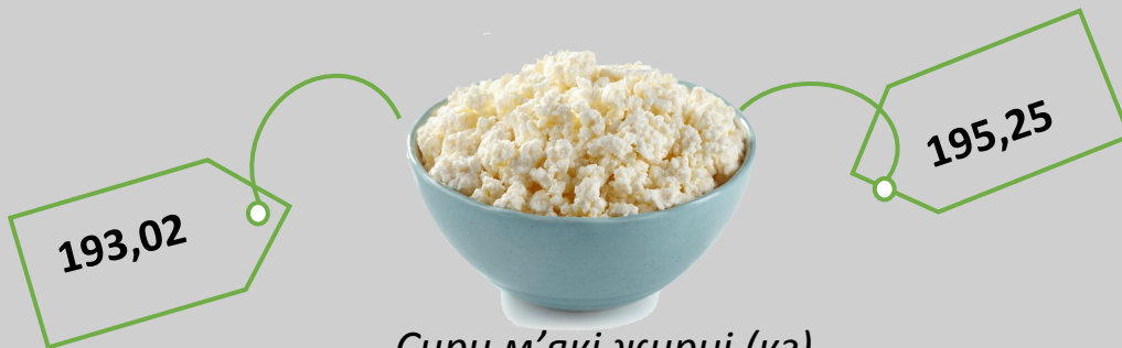
Сири м'які жирні (кг)