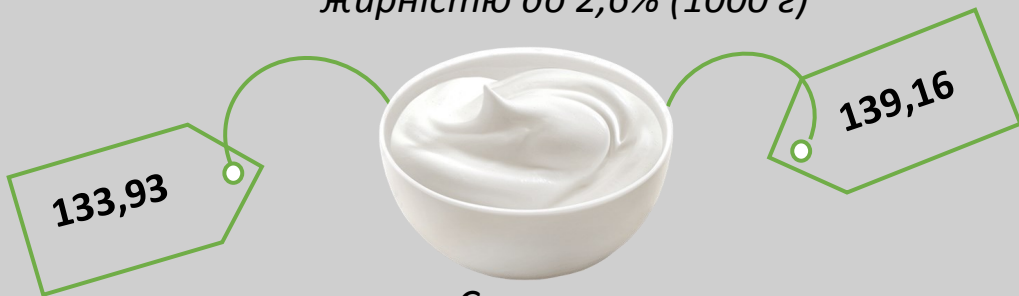
Сметана жирністю до 15% (кг)