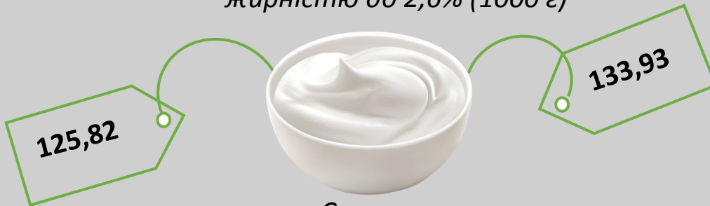
Сметана жирністю до 15% (кг)