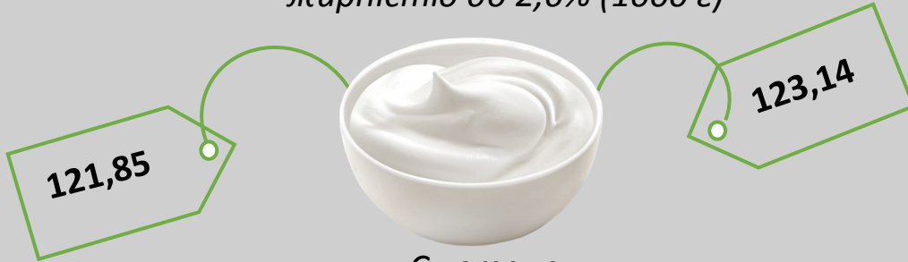
Сметана жирністю до 15% (кг)