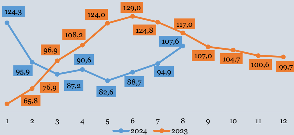
Темпи зростання (зниження) експорту товарів